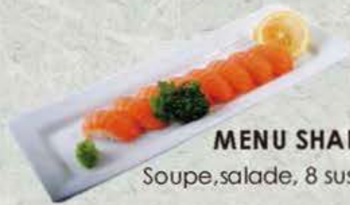
MENU SHAKE 16,00€ Soupe, salade, 8 sushi saumon