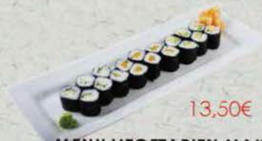
MENU VEGETARIEN MAKI 13,50€ soupe, salade 6 maki concombre 6 maki avocat 6 maki oshinko