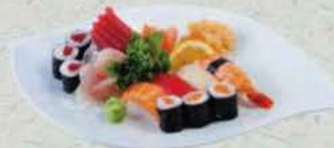
MENU D 20,50€ Soupe, Salade. riz 9 Sashimi, 4 Sushi 6 maki