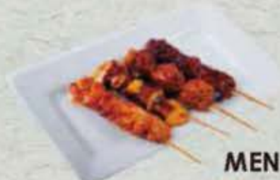
MENU Y4 10,50€ Soupe, salade, riz 4 brochettes