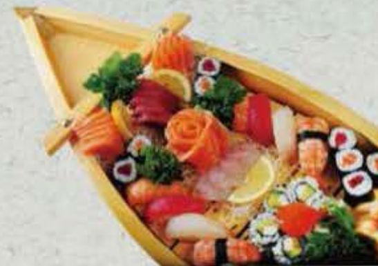
MENU KIWA ROYAL 50,00€ (pour deux personnes) 2 Soupe, 2 Salade, 2 riz 21 sashimi, 8 sushi 12 maki, 6 california