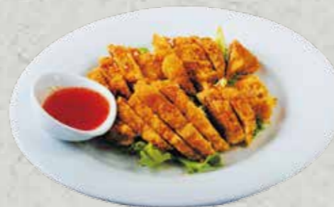
MENU B 11,50€

Soupe, Salade, riz Tori katsu ( Blanc de Poulet pané frits)