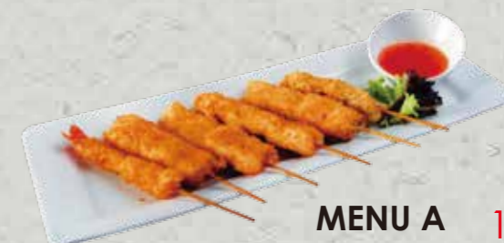
MENU A 15,80€

Soupe, salade, riz panaché de brochettes, poissons et légumes, sauce tonkatsu