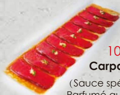
10,80€ Carpaccio de thon (Sauce spéciale de maison Parfumé aux sésame)

(Sauce spéciale de maison Parfumé aux sésame)