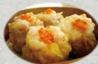
Shumai Crevette 5p. 5,50€