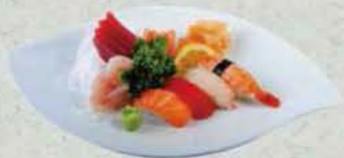
MENU KYOTO 20,50€ Soupe, Salade, Riz 12 sashimi, 4 sushi.