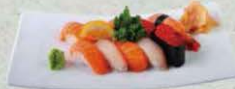
MENU SUSHI 19,80€ Soupe, salade 10 sushi (assortiment)