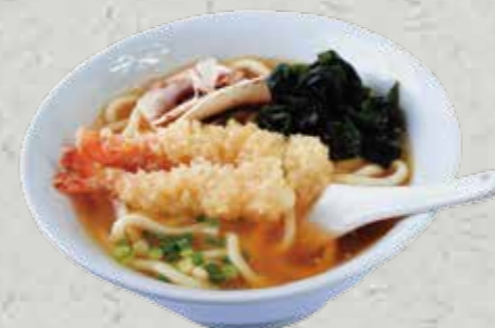
Tempura udon MENU UDON (Soupe de nouilles et Crevettes frits) 12,80€