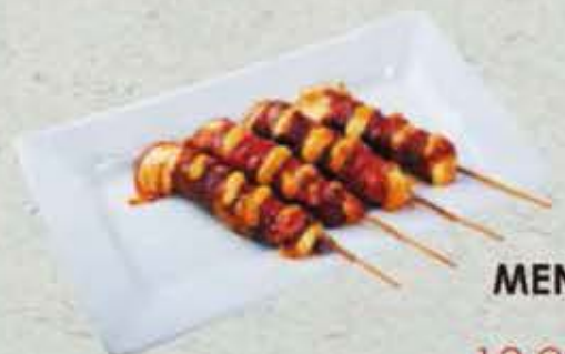
MENU Y6 13,80€ Soupe, salade, riz 4 brochettes boeuf fromage