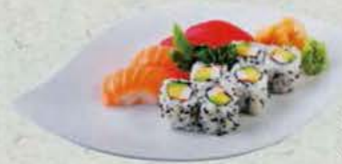
MENU J 14,50€ Soupe, salade 4 sushi varié 6 california maki