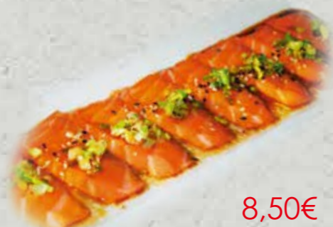
8,50€ Carpaccio de saumon

Soupe, salade, riz panaché de brochettes, poissons et légumes, sauce tonkatsu