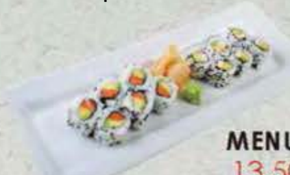
MENU CALI 13,50€ Soupe, salade 12 maki california mix. (Saumon et surimi)