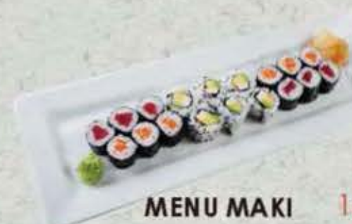
MENU MAKI 15,00€ Soupe, salade 6 maki saumon 6 maki thon 6 california surimi ou saumon