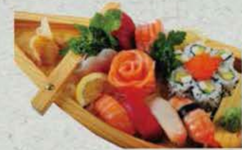
MENU KIWA 23,80€ Soupe, Salade, riz 15 sashimi, 4 sushi 6 california surimi