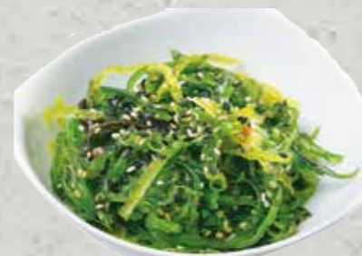
Salade de poulpes et légumes 6,50€ salade d'algues wakame 6,00€