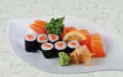
MENU OSAKA 16,00€ Soupe, salade 3 sashimi saumon 4 sushi saumon 6 maki saumon