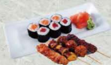
MENU Y1 15,00€ Soupe, salade, riz 6 maki, 4 brochettes