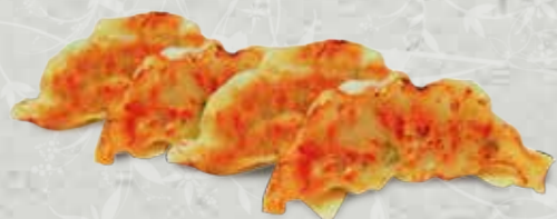
Gyoza 5p 5,00€ (Ravioli grille poulet et légumes)