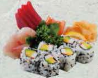
MENU E 18,00€ Soupe, salade 12 sashimi 6 california (Saumon ou surimi au choix)