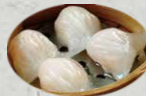
Hagao 5p 5,50€