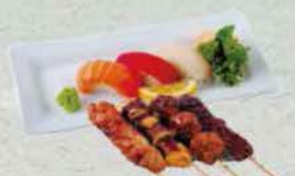
MENU Y2 15,00€ Soupe, salade, riz 3 sushi, 4 brochettes