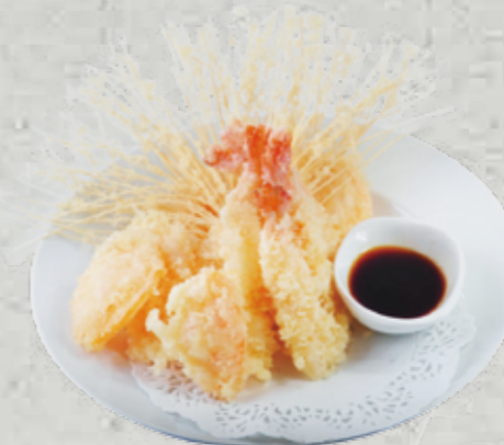
MENU Tempura 15,80€

Soupe, salade, riz Assortiment de tempura Crevettes et légumes frits