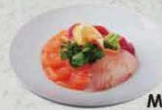
MENU CHIRASHI Soupe, salade saumon 12,50€ saumon avocat 13,50€ thon 14,80€ thon avocat 15,80€ assortiment 14,80€