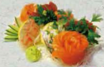
MENU SASHIMI 20,50€ Soupe, salade. Riz 18 tranches sashimi (Assortiment de poisson cru)