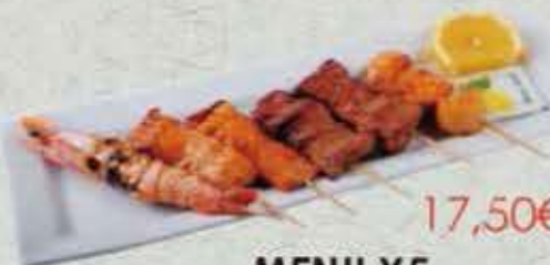
MENU Y5 17,50€ Soupe, salade, riz 2 brochettes saumon 2 brochettes thon 1 brochettes gambas 1 brochettes st-jacques