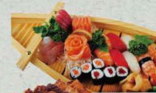
MENU SAINT VALENTIN 52,00€ (Pour deux personnes) 2 soupe, 2 salade, 2 riz, 18 sashimi, 8 sushi 6 maki 6 brochettes. ( 2 poulet, 2 saumon 2 boeuf au fromage)