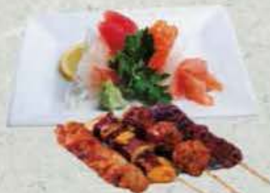
MENU Y3 15,00€ Soupe, salade, riz 6 sashimi, 4 brochettes