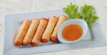
Nems aux crevettes 5p 5,80€ Nems aux poulet 5p 5,80€

Soupe, Salade, riz Tori katsu ( Blanc de Poulet pané frits)